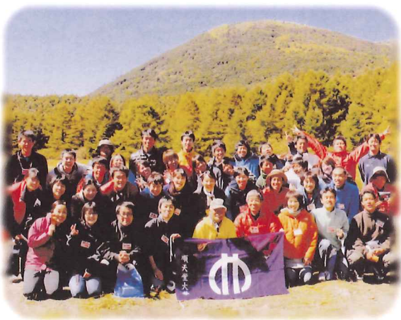
大学の学生たちと