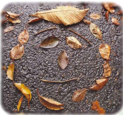
大地のキャンパス(幼稚園児たちと雨上がりに)

今までボランティアで関わってきた「自然体験」の経験を生かし「あかぎの森のようちえん」を設立し、主に幼児への自然体験活動プログラムを提供している。