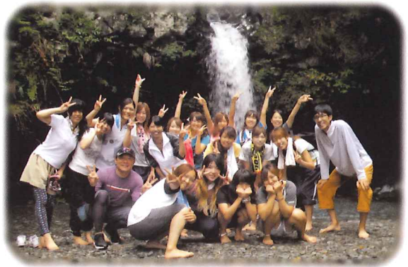
MTBの目的地、陣馬の滝にての一コマ

その後、そのスタッフたちとの交流が徐々に増え、切磋琢磨してきたことで今日の自分があると思っています。現在の朝霧野外活動センターの職員はその当時から付き合いのある仲間であり、いつでも温かく迎えてくれるということが、このキャンプ場に通い詰める最大の要因になっています。