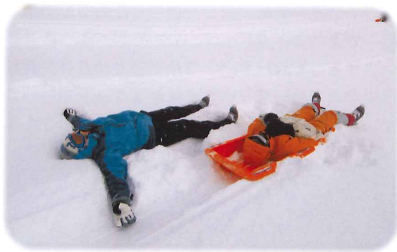
ヘトヘトになるまでソリ遊び

どこまでも澄んだ冷たい風、マッキンリーの優しい山容、遠くに響く雪崩の音、降るような星空とオーロラのゆらめき——目を閉じれば、いつでもあの風景と共に、自分自身との深いつながりも思い出すことができる——それが、私の好きなフィールド 米国アラスカ州 ルース氷河です。