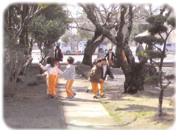
「ちょっとだけよ」を使った活動

初めて出会った仲間にもかかわらず、短い時間内に意見を出し合い、笑いがたえない中から出てきた“名作”と自負しています