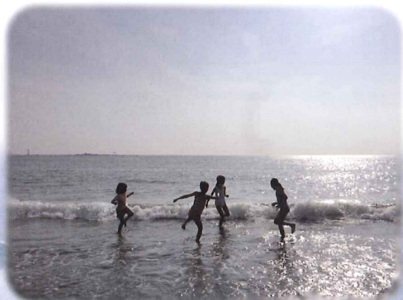
葉山の海で躍動する子どもたち

1995年登山家戸高雅史と結婚し、パキスタン・ネパール・チベットのヒマラヤ登山のベースキャンプマネージャーを務める。子どもが生まれてからは出会う母たちと、自然を舞台に、共に育ちあう場を創り続けている。