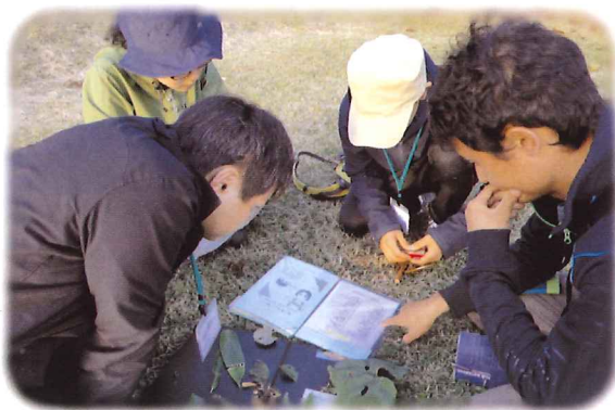
個性のぶつかり合いでようやく形になった瞬間

「自分たちで作ってみる」の時間は非常に短く、2日目の夕方から夜にかけての数時間しかありません。限られた時間で仕上げるのは大変ですが、仲間と力を合わせて意見をぶつけ合いながらの作業は非常に心地よいものでした。既にシートになっているものはダメ、ありきたりじゃダメ、でも広く活動してもらえる内容が良い…と、試行錯誤で形になって企画書を提出できたのは、確か締切4分前のこと。翌日は発表と講師による講評がありましたが、どのグループも自分たちの案が一番魅力的であると信じて、堂々と発表していました。